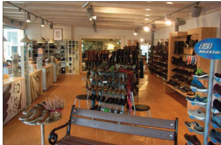
Ein Blick in den modern gestalteten Verkaufsraum.

Beteiligten für die erstklassige Arbeit zu bedanken. Wirft man einen Blick auf die Internetseite www.schuhhaus-popp.de findet